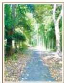
もともとこの辺りにササケノコが生産地。プレイパーク近くの「ゆうほえのみち」の竹林