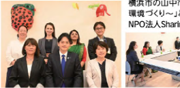
Welcome International Families! Share your parenting issues!