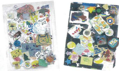
4つの団体がそれぞれの表現で作った作品を 持ち寄って大きな作品を作りました

※カブカブ川和は喫茶店をしたり、お菓子を作ったり、絵をかいたり、織物をしたり、1人1人を認め合いおおらかでゆるい空気感のある居心地の良い場所です。