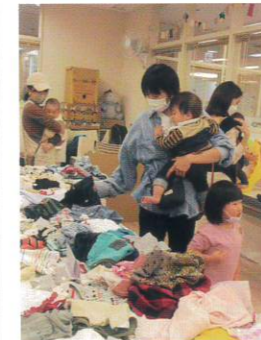
「おさかり・おゆずり会」 (第2回目も企画!!)