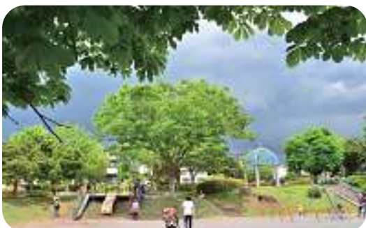
大きなとちの木がある公園だよ☆