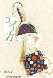
「キーホルダー」 ◎鶴見佑太