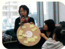
中野都筑区長からも激励のお言葉をいただきました。

参加された皆さまからは、「いつでも子育て中の親子を気にかけているよ」という気持ちから、笑顔や挨拶など、声をかけることで伝えていきたいという思いや、子どものそばに安心できる大人が増えていくことの大切さなどを語り合いました。