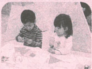
はさみてキョッキン!