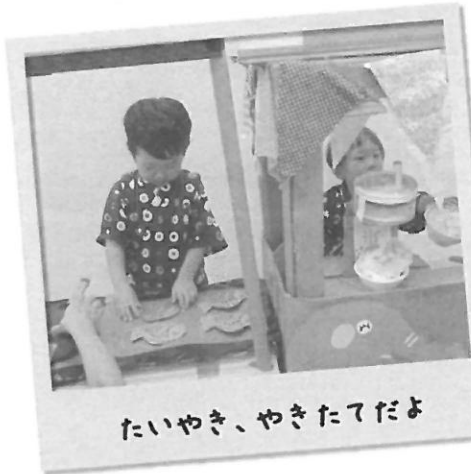
たいやき、やきたてだよ

8月、初めての“ポポラのなつまつり”を開催しました。会場には屋台がいっぱい♪ 小さい時にポポラに来てくれていたお友だちも久しぶりに会えると嬉しいな、という思いもありました。 当日は、かわいい甚平や浴衣姿で来てくれたお友だちもいて、たくさんのご家族の参加があり、みんなでわいわいとても楽しい1日になりました。