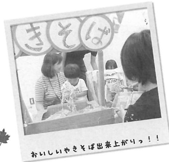
おいしいやきそば出来上がりっ！！

みんなのキラキラ笑顔がみられてポポゾウも嬉しかったゾウ～！平成最後の夏に素敵な思い出ができました！ “なつまつり”楽しかったね。 みんなの夏の思い出になってくれていていいな。また遊びに来てね！