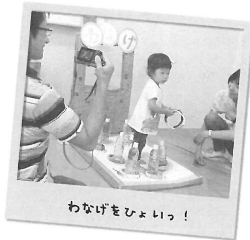
わなげをひょいっ！

ひろばでママたち子どもたちにお手伝いしてもらった本物さながらのたいやき、やきそば、かき氷。。。ママやパパに「どうぞ～！おいしいよ～！」と作ってあげている楽しそうな声があちこちで聞こえました。わなげ、ヨーヨー釣り、金魚すくいのコーナーでは夢中になって遊んでいましたよ。