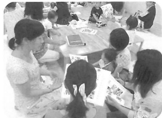
親の出番はどれくらい?

先輩ママのみなさん、ご協力ありがとうございました。そして、今回参加されたママたちもいつか先輩ママになってくださいね☆