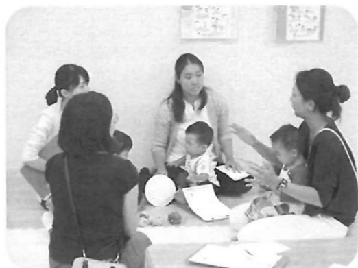
給食とお弁当どっちがいいの?

参加したママたちからは「ホームページでは分からないことが聞いて良かった」「一緒にいられる今の時間を大切にしながら、子どもに合う園を選びたいと思います」などの嬉しい感想が聞けました♪