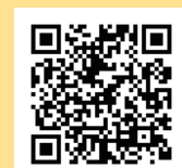
Sharing Caring Culture