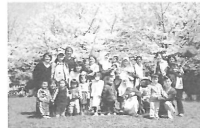
毎年恒例4月チャルラスお花見